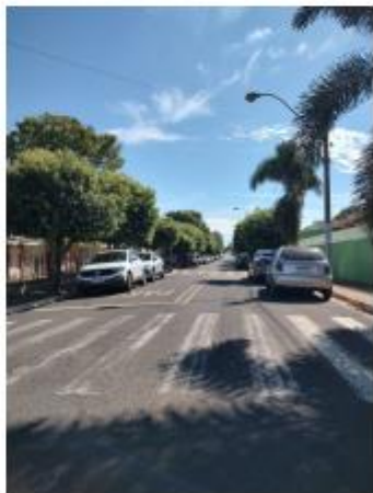
Foto 14 – Rua Iraldo Antônio Martins de Toledo, trecho entre a Rua Iraldo Antônio Martins de Toledo e a Av. Pedro Antônio Gomes