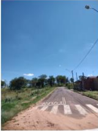
Foto 19 – Rua Vereador Miyashita Tiuiti, trecho entre a Av. Kenji Muramatsu e a Rua Sely Francisco Rocha

Avenida Campos Salles, 113 – CEP 17760-000 - Inúbia Paulista - Estado de São Paulo.