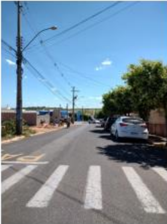
Foto 32 – Rua Antônio Facco, trecho entre a Rua Antônio Facco e a Av. Leão Miguel Banwart