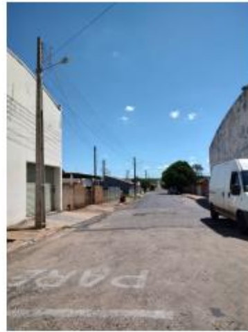
Foto 5 – Rua Armando Delai, trecho entre a Rua Armando Delai e a Rua Miguel Pereira