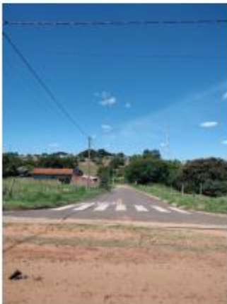
Foto 20 – Rua Vereador Miyashita Tiuiti, trecho entre a Av. Kenji Muramatsu e a Rua Antônio Ishihira