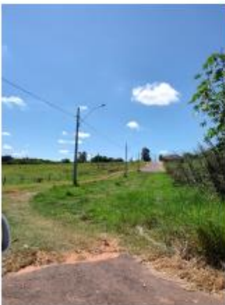
Foto 28 – Av. Marechal Deodoro da Fonseca, trecho entre a Av. Marechal Deodoro da Fonseca e Rua Sebastião Pereira