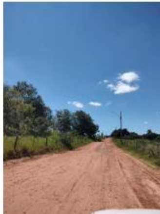
Foto 30 – Rua Antônio Ishihira, trecho entre a Rua Antônio Ishihira e a Rua Vereador Miyashita Tiuiti