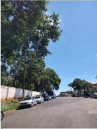
Foto 7 – Rua Vereador Luiz Cassandre, trecho entre a Rua Vereador Luiz Cassandre ao lado da prefeitura

Avenida Campos Salles, 113 – CEP 17760-000 - Inúbia Paulista - Estado de São Paulo.