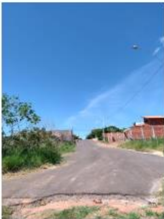
Foto 24 – Rua Sebastião Pereira, trecho entre a Rua Sebastião Pereira e Av. Marechal Deodoro da Fonseca