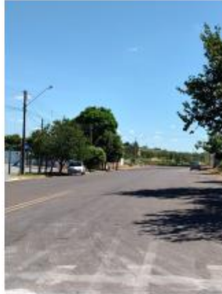
Foto 21 – Av. João Elvino, trecho entre a Av. João Elvino e Av. Leão Miguel banwart