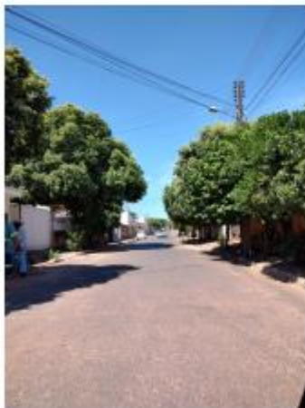
Foto 12 – Rua Antônio do Prado, trecho entre a Rua Antônio do Prado e a Av. Marechal Deodoro de Fonseca