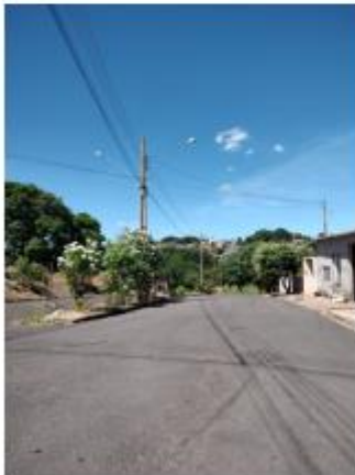
Foto 16 – Av. Kenji Muramatsu, trecho entre a Av. Kenji Muramatsu e a Rua Antônio Ishihira