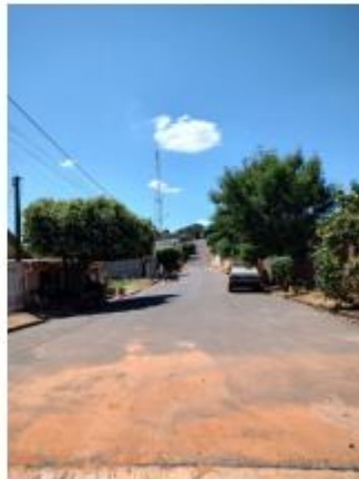
Foto 26 – Rua Miguel Pereira da Silva, trecho entre a Rua Miguel Pereira da Silva e Rua Sebastião Pereira