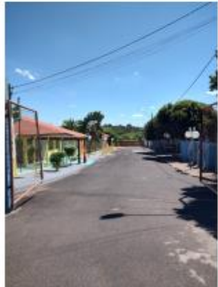
Foto 36 – Rua João Gerônimo Lopes, trecho entre a Rua João Gerônimo Lopes e a Av. Leão Miguel Banwart