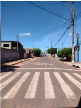
Foto 8 – Rua Vereador Luiz Cassandre, trecho entre a Rua Vereador Luiz Cassandre e Av. Marechal Deodoro de Fonseca