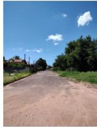
Foto 38 – Rua Sely Francisco Rocha, trecho entre a Rua Sely Francisco Rocha e a Rua Miyashita Tiuiti