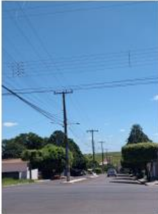
Foto 15 – Av. Kenji Muramatsu, trecho entre a Av. Kenji Muramatsu e a Av. Leão Miguel Banwart

Avenida Campos Salles, 113 – CEP 17760-000 - Inúbia Paulista - Estado de São Paulo.