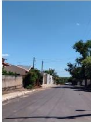
Foto 17 – Rua Vereador Miyashita Tiuiti, trecho entre a Av. Kenji Muramatsu e a Av. Leão Miguel Banwart