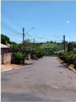
Foto 23 – Rua Sebastião Pereira, trecho entre a Rua Sebastião Pereira e Av. Leão Miguel Banwart

Avenida Campos Salles, 113 – CEP 17760-000 - Inúbia Paulista - Estado de São Paulo.