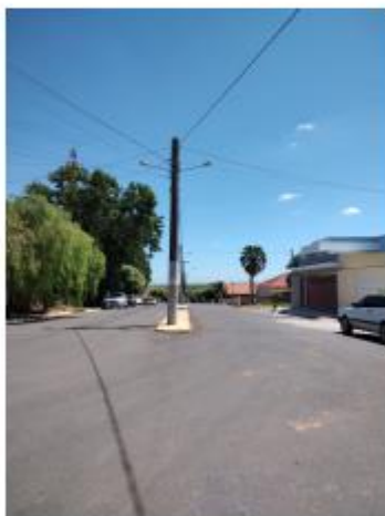
Foto 1 – Avenida Pedro Antônio Gomes, trecho entre a Av. Pedro Antônio Gomes e a Rua Guaianases