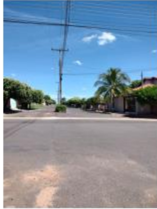
Foto 29 – Av. Marechal Deodoro da Fonseca, trecho entre a Av. Marechal Deodoro da Fonseca e Av. Pedro Antônio Gomes