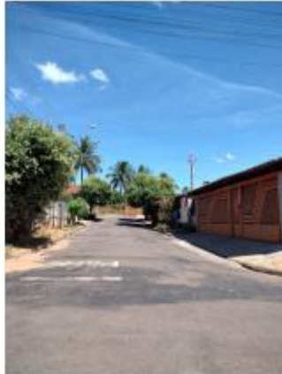
Foto 25 – Rua Djalma Moreira, trecho entre a Rua Djalma Moreira e Rua Sebastião Pereira