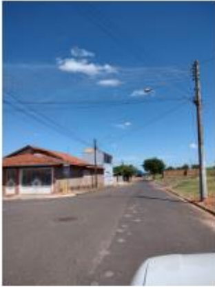
Foto 31 – Rua Antônio Ishihira, trecho entre a Rua Antônio Ishihira e a Av. Pedro Antônio Gomes

Avenida Campos Salles, 113 – CEP 17760-000 - Inúbia Paulista - Estado de São Paulo.