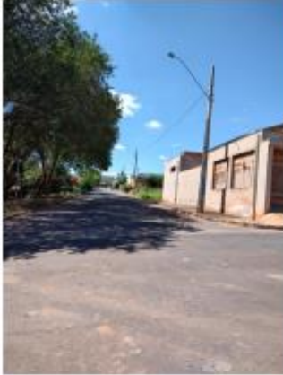
Foto 35 – Rua Floriano Peixoto, trecho entre a Rua Floriano Peixoto e a Av. Kenji Muramatsu

Avenida Campos Salles, 113 – CEP 17760-000 - Inúbia Paulista - Estado de São Paulo.