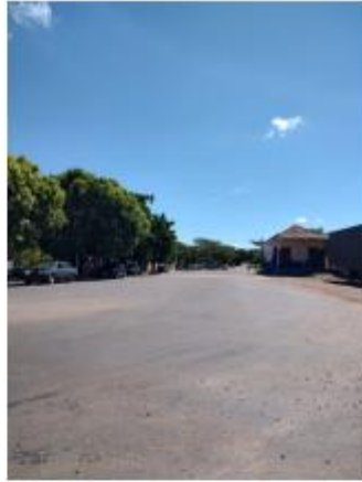
Foto 9 – Av. Indústria e Comércio, trecho entre Av. Indústria e Comércio e Av. Campos Sales