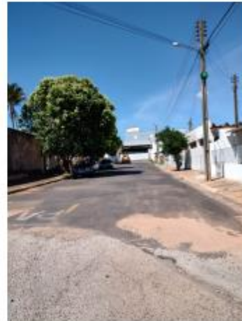
Foto 6 – Rua Armando Delai, trecho entre a Rua Armando Delai e Av. Marechal Deodoro de Fonseca