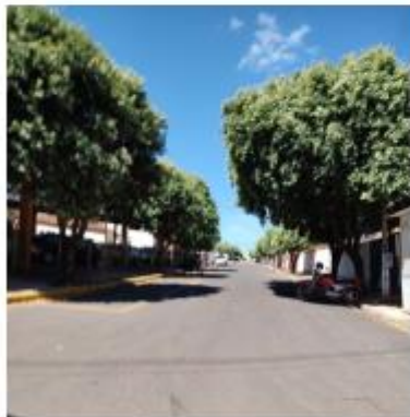
Foto 4 – Rua Armando Delai, trecho entre a Rua Armando Delai e a Av. Leão Miguel Barwart