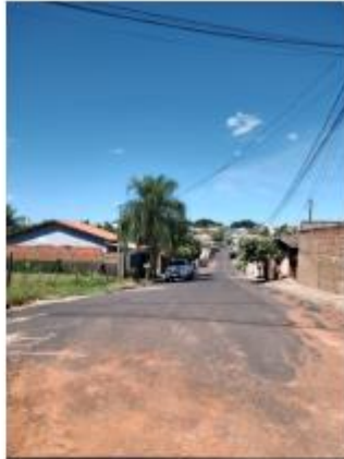
Foto 33 – Rua Antônio Facco, trecho entre a Rua Antônio Facco e a Rua Antônio Ishihira