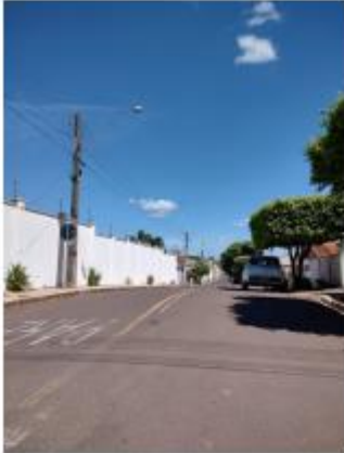
Foto 27 – Rua Miguel Pereira da Silva, trecho entre a Rua Miguel Pereira da Silva e Rua Armando do Prado

Avenida Campos Salles, 113 – CEP 17760-000 - Inúbia Paulista - Estado de São Paulo.