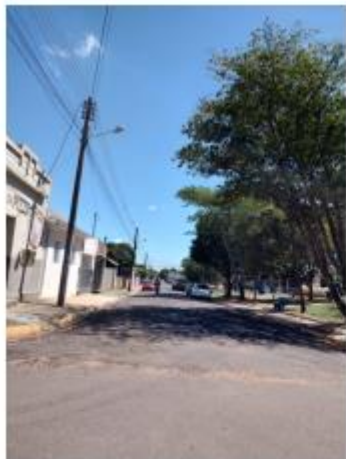
Foto 11 – Rua Antônio do Prado, trecho entre a Rua Antônio do Prado e a Rua Iraldo Antônio Martins de Toledo

Avenida Campos Salles, 113 – CEP 17760-000 - Inúbia Paulista - Estado de São Paulo.