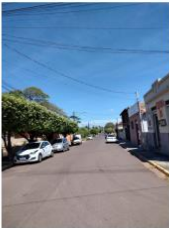
Foto 13 – Rua Iraldo Antônio Martins de Toledo, trecho entre a Rua Iraldo Antônio Martins de Toledo e a Rua Antônio do Prado