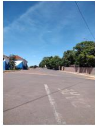
Foto 10 – Av. Indústria e Comércio, trecho entre Av. Indústria e Comércio e Rua Iraldo Antônio Martins de Toledo