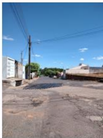
Foto 34 – Rua Floriano Peixoto, trecho entre a Rua Floriano Peixoto e a Av. Pedro Antônio Gomes