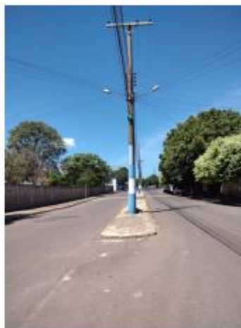
Foto 2 - Avenida Pedro Antônio Gomes, trecho entre a Av. Pedro Antônio Gomes e Av. Marechal Deodoro da Fonseca