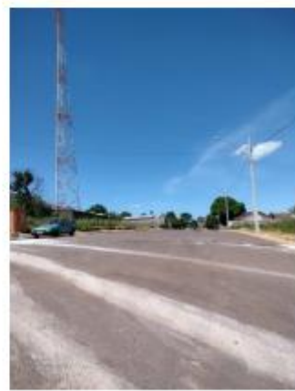
Foto 22 – Av. João Elvino, trecho entre a Av. João Elvino e Av. Marechal Deodoro da Fonseca