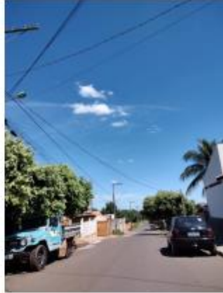
Foto 37 – Rua Sely Francisco Rocha, trecho entre a Rua Sely Francisco Rocha e a Av. Pedro Antônio Gomes