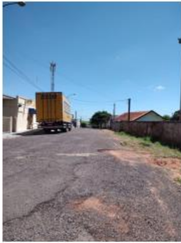
Foto 3 – Rua Armando Delai, trecho entre a Rua Armando Delai ao lado do Correio

Avenida Campos Salles, 113 – CEP 17760-000 - Inúbia Paulista - Estado de São Paulo.