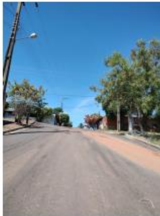
Foto 18 – Rua Vereador Miyashita Tiuiti, trecho entre a Av. Kenji Muramatsu e a Rua Marechal Floriano Peixoto