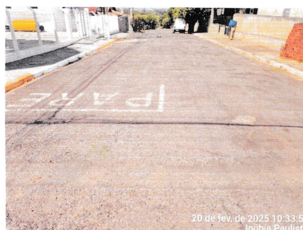
06A - RUA GUAIANASES: trecho entre a Av. Kenji MMuramatsu e a Rua Antonio Facco. (medindo: 7,60m larg.x84,60m compr.= 642,96m² );