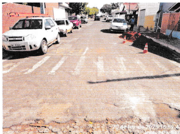
05B – RUA IRALDO ANTONIO MARTINS DE TOLEDO: trecho entre a Rua Antonio Facco e a Av. Pedro Antonio Gomes. (medindo: 7,65m larg.x84,70m compr.= 647,95m² );