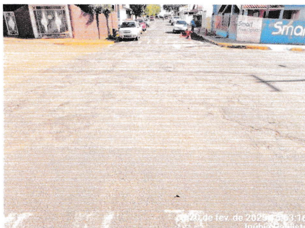
05C – RUA IRALDO ANTONIO MARTINS DE TOLEDO: trecho do cruzamento da Rua Iraldo Antonio Martins de Toledo com a Av. Pedro Antonio Gomes (medindo: 9,00m larg.x15,00m compr.= 135,00m² );